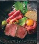
オーダーカットステーキ 米沢牛刺し身盛り合せ